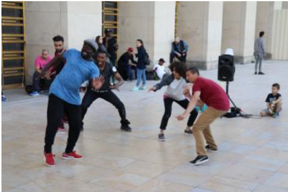
法国艺人的街头表演

为期两个多月的学习交流转瞬即逝，我们对此次的学习之旅非常的开心和怀念。巴黎的风土人情、欧式典雅风格建筑以及那里优雅的