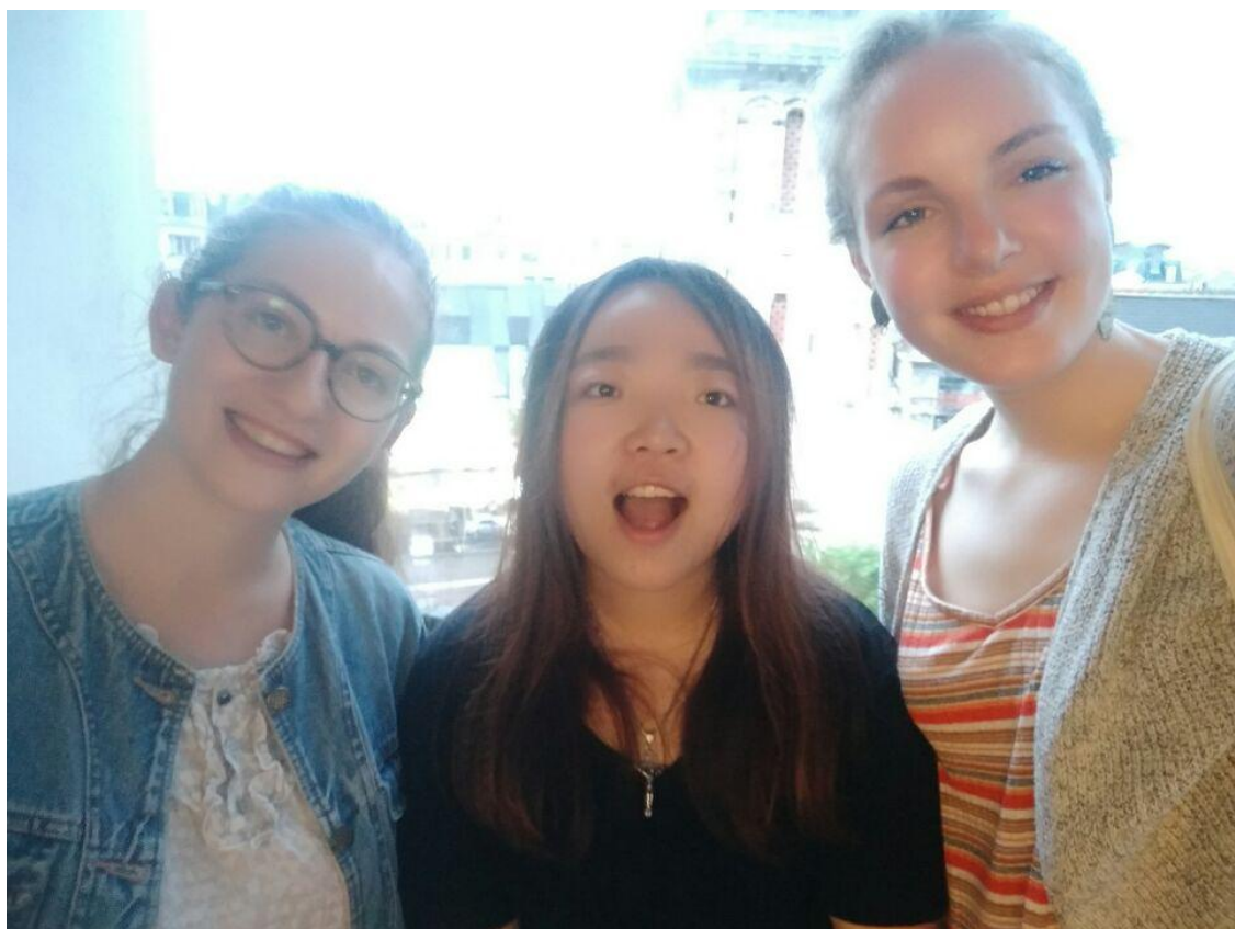
我们与法国朋友的生活合影

在平时下班时间，我和同学会去公园里面跑步，锻炼身体，每天都坚持跑 4 公里。在我工作的第三周，我两位法国同事来我们家里做客，我们在中国红超市买到了很多中国特色食材，然后做了一桌丰盛的中国风味晚宴招待法国朋友。