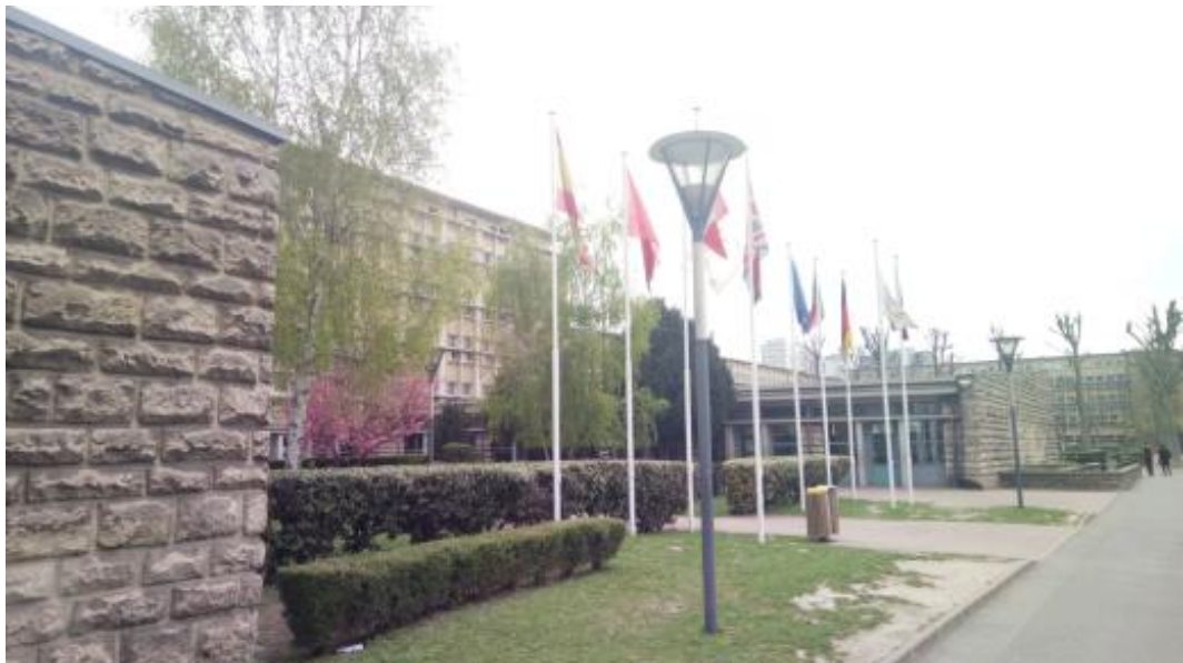
法国巴黎巴尔扎克国际学校外景

我们在法国的时间是从 3 月 30 日至 6 月 6 日，学习交流主要分为两个部分，学习部分：我在法国巴黎巴尔扎克国际学校进行两周的学习交流；实习部分，我在学校提供的公司平台进行实习，学习法国公司的经营管理模式和产品营销理念。